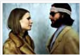
THE ROYAL TENENBAUMS

WES ANDERSON / VERENIGDE STATEN / 2001 / 01u 50min / 35 mm / D: ENGELS, OT: NEDERLANDS