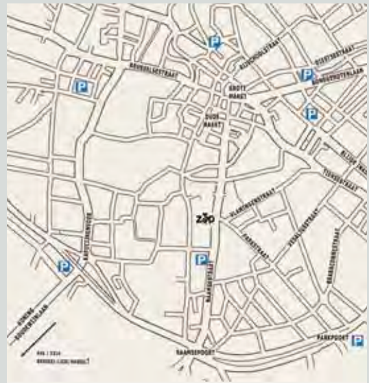
CINEMA ZED - NAAMSESTRAAT 96 - 3000 LEUVEN

Leuven telt heel wat parkings. De dichtst bijzijnde is de Parking Heilig Hart, een grote ondergrondse parkeerplaats, tevens gelegen in de Naamsstraat, ongeveer 200 meter van het STUK-gebouw en Cinema ZED.