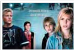
DE VERLOREN SCHAT VAN DE TEMPELRIDDERS

Ierland, 9de Eeuw. Brendan, een weesjongen van twaalf leeft in de abdij van Kells. Op een dag ontmoet hij de oude broeder Aidan, een meester in het illustreren. Hij houdt een buitengewoon, nog onvoltooid boek in bewaring. Begeesterd door deze ontmoeting laat Brendan zich meeslepen door de lokroep van de creativiteit. Hij heeft nog slechts één doel voor ogen: zelf meester-illustrator worden en het waardevolle Book of Kells afwerken. Vijandige Vikings, een heidense slangengod en een woudgeest kruisen zijn pad tijdens zijn angstaanjagende tocht naar de verbeelding. (TOMM MOORE / FRANKRIJK, BELGIË, IERLAND / 2009 / 1u 15u / 35mm / NEDERLANDS GESPROKEN / VANAF 9 JAAR)