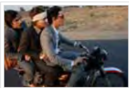
THE DARJEELING LIMITED