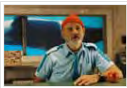
THE LIFE AQUATIC WITH STEVE ZISSOU

WES ANDERSON / VERENIGDE STATEN / 2007 / 01u 48min / 35mm / D: ENGELS, OT: NEDERLANDS