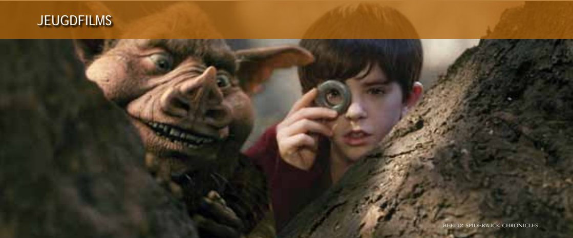
BEELD: SPIDERWICK CHRONICLES