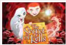
BRENDAN, HET GEHEIM VAN KELLS