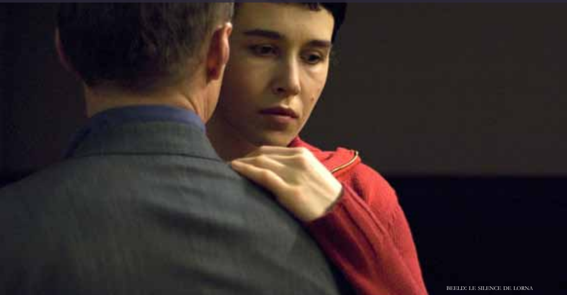
BEELD: LE SILENCE DE LORNA